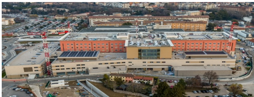
Foto: Cittadella di Treviso in costruzione

Nel 2023 già eseguito e consegnato il Collaudo Statico relativo alle strutture dei lavori di realizzazione della Nuova Cittadella Sanitaria presso l'ospedale Cà Foncello di Treviso I a Fase edifici 29, 30A e 30B e 36 ecc.